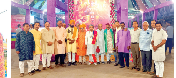
हरिभूमि न्यूज ▶ सोहागपुर