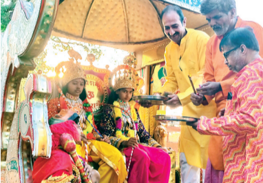
हरिभूमि न्यूज ▶ सोहागपुर

श्रीराम जन्मोत्सव समिति की इस एकात्म शोभायात्रा का विभिन्न स्थानों पर राजनीतिक व सामाजिक संगठनों ने अभिनंदन किया। जल, शरबत, मिष्ठान व फलाहारी खाद्य पदार्थों के साथ श्रीराम भक्तों का मुस्लिम समाज सोहागपुर,