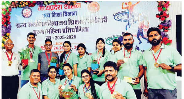
पचमढ़ी

उच्च शिक्षा विभाग, मध्य प्रदेश शासन द्वारा आयोजित राज्य स्तरीय अंतर्विध्यालयीन शिक्षक एवं कर्मचारी खेल प्रतियोगिता में राजा भभूत सिंह शासकीय महाविद्यालय, पचमढ़ी के अधिकारियों ने उत्कृष्ट प्रदर्शन करते हुए क्षेत्र का नाम रोशन किया है। भोपाल संभाग का प्रतिनिधित्व करते हुए महाविद्यालय के क्रीड़ा अधिकारी और लाइब्रेरियन ने बैडमिंटन स्पर्धा में स्वर्ण पदक पर कब्जा जमाया।