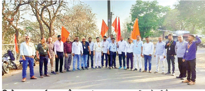
विरोध प्रदर्शन और लंच बहिष्कार

आयुध निर्माणी इटारसी में प्रमोशन प्रक्रिया लंबित होने से कर्मचारियों का गुस्सा फूट पड़ा और उन्होंने जोरदार विरोध प्रदर्शन किया। लंच बहिष्कार के साथ कर्मचारियों ने प्रशासन पर उदासीनता का आरोप लगाते हुए जल्द पदोन्नति शुरू करने की मांग की।