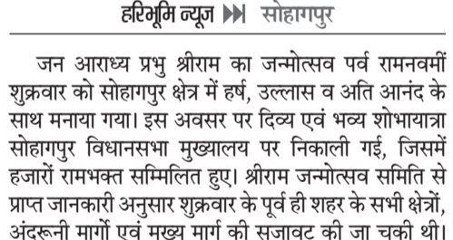
हरिभूमि न्यूज ▶ सोहागपुर

जन आराध्य प्रभु श्रीराम का जन्मोत्सव पर्व रामनवमी शुक्रवार को सोहागपुर क्षेत्र में हर्ष, उल्लास व अति आनंद के साथ मनाया गया। इस अवसर पर दिव्य एवं भव्य शोभायात्रा सोहागपुर विधानसभा मुख्यालय पर निकाली गई, जिसमें हजारों रामभक्त सम्मिलित हुए। श्रीराम जन्मोत्सव समिति से प्राप्त जानकारी अनुसार शुक्रवार के पूर्व ही शहर के सभी क्षेत्रों, अंदरूनी मार्गों एवं मुख्य मार्ग की सजावट की जा चुकी थी। शोभायात्रा के समूचे मार्गों को सुंदर एवं भव्य रूप के साथ सजाया गया। वहीं शुक्रवार की शाम पांच बजे के बाद नर्मदापुरम मार्ग स्थित शिव पावती मंदिर से रामनवमी की मुख्य शोभायात्रा प्रारंभ हुई। इस शोभायात्रा में आसपास के ग्रामीण क्षेत्रों की शोभायात्राएं भी जुड़ीं। मुख्य शोभायात्रा रामगंज वार्ड, मातापुरा वार्ड क्षेत्र भ्रमण करते हुए बिहारी चौक पहुंचीं। जहां शहर के अन्य भागों तथा समीप के ग्रामीण क्षेत्रों से आई शोभायात्राएं भी पहुंचीं। बिहारी चौक से शोभायात्रा का भव्य एकात्म रूप आगे बढ़ा। श्रीराम जन्मोत्सव समिति से प्राप्त जानकारी अनुसार शोभायात्रा कमनिया गेट से होते हुए श्रीराम चौक पहुंची, जहां शानदार आतिशबाजी की गई। यहां से