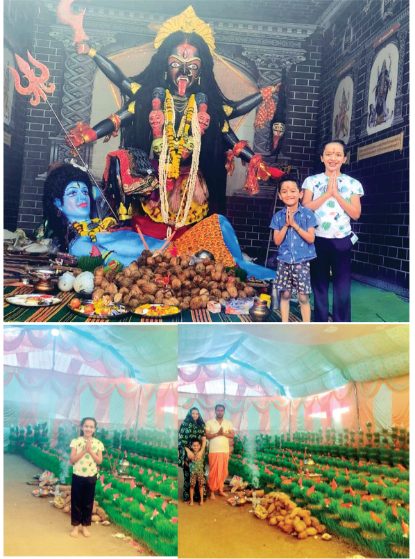
माखननगर

पंडित माखनलाल चतुर्वेदी सभागार भवन के पास ज्वाला देवी परिसर में चैत्र नवरात्रि में 251 घट की स्थापना कर ज्वारे रखे हैं। इसी